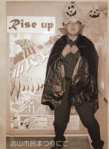
流山市民まつりにて