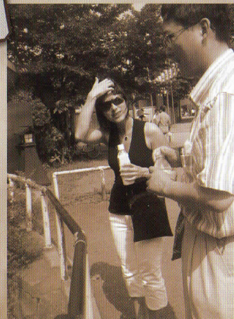
ガイドの様子 (アメリカ人)