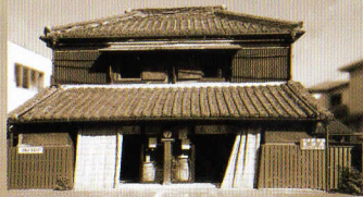
2010 年 8 月 流山 2 丁目にオープンした見世蔵