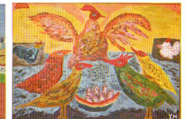
市展に出品した作品