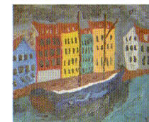
コペンハーゲン (デンマーク)